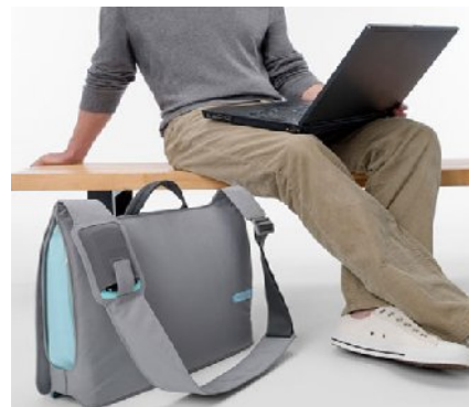
Válltáska és laptop... hmm...

IGEN , a válltáska gerincferdülést is okozhat, bár nem olyan könnyen, ahogy ezt egyesek állítják... Bár ez nyilvánvaló, mivel a súly oldalra húzza a gerincet, ezért ez huzamosabb idő után elferdül. Hogyan is előzhetjük meg? Naponta váltogatjuk az oldalt, ahol a táskát hordjuk, és lehetőleg ne túl nagy súlyt vigyünk táskánkban. Ami azt illeti a hátizsák is csak akkor egészséges, ha elől, egy vastagabb pánttal összekötjük a hasunknál, így a súly nem fogja a vállainkat hátrahúzni. Egyébként ez is ugyanúgy gerincferdüléshez vezethet.